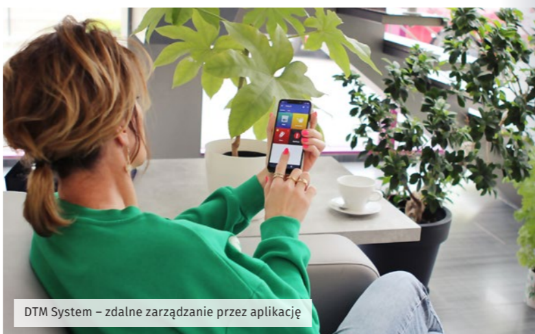
DTM System – zdalne zarządzanie przez aplikację