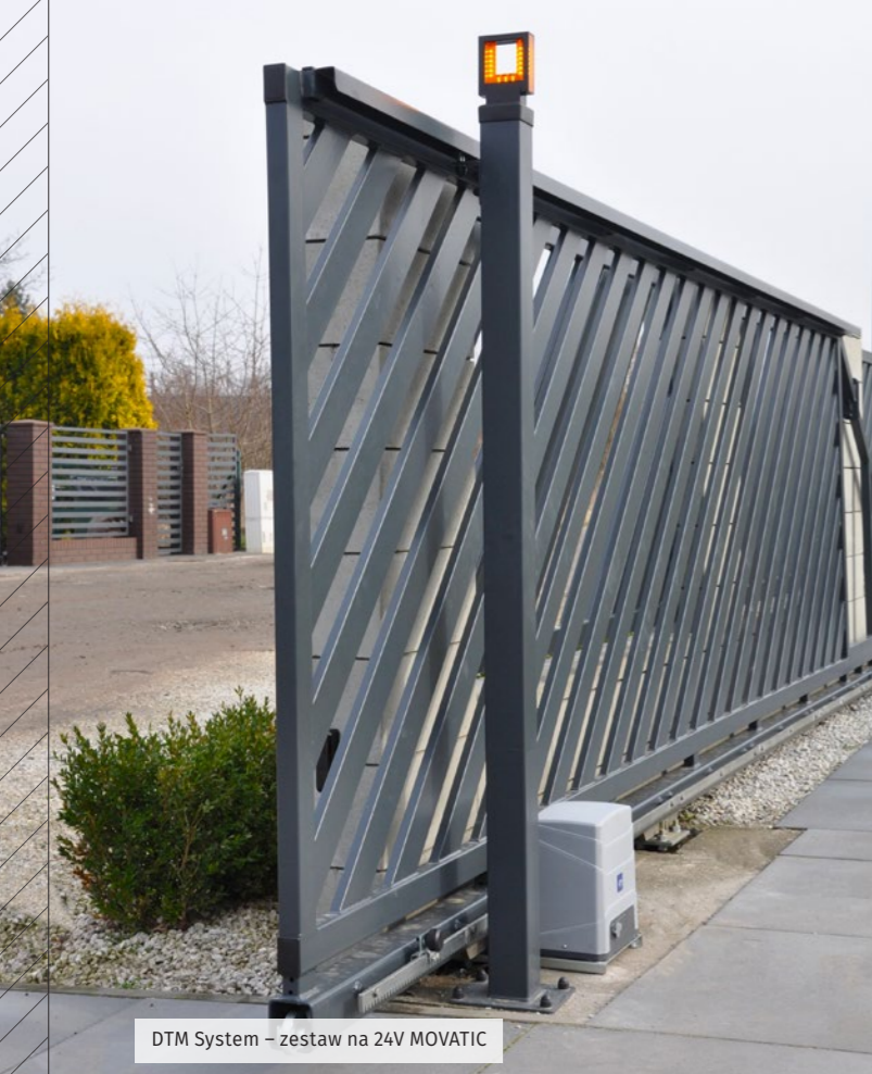
DTM System – zestaw na 24V MOVATIC