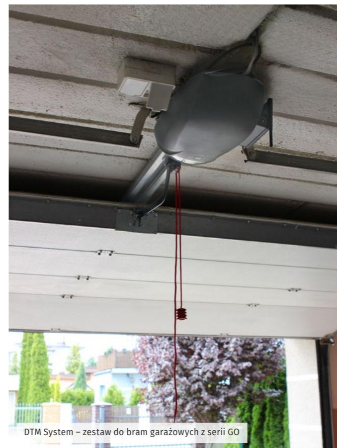
DTM System – zestaw do bram garażowych z serii GO