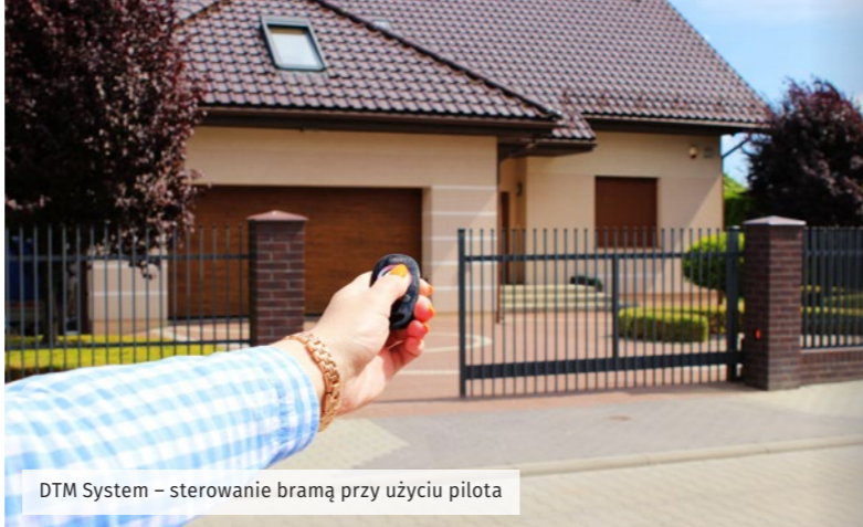
DTM System – sterowanie bramą przy użyciu pilota